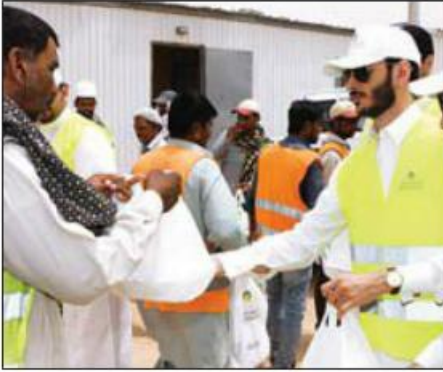
الشباب يقدمون الوجبات للعمال

البناء، والنظافة، والصيانة، وخدمات التحميل والتفريغ، حيث بادروا إلى تبادل الأحاديث الودية معهم، وتوزيع وجبات الغذاء عليهم، انطلاقاً من قيم التراحم والتواد والتكافل الاجتماعي التابعة من تعاليم ديننا الحنيف، وتقاليد وأعراف المملكة الأصيلة. وأعرب المشاركون في المبادرة عن سعادتهم بهذه التجربة، التي أتاحت لهم الفرصة للمساهمة في فعل الخير وإبخال البهجة والسرور في نفوس العاملين الذين أبدوا بدورهم شكرهم وتقديرهم على هذه اللفتة الإنسانية المميزة. من جانبها قالت مي الهوشان، مدير عام الموارد البشرية في البنك السعودي الهولندي، أن هذه المبادرة تأتي في سياق مبادرات البنك وأنشطته الموجهة لخدمة المجتمع.