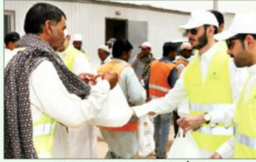
٢٠ شاباً من مختلف التخصصات الجامعية شاركوا بالبرنامج

يشار إلى أن ٢٠ شاباً من مختلف التخصصات الجامعية كانوا قد باشرُوا بالتحاق بمسارات برنامج «المتدرب الإداري»، والذي أطلقه البنك في شهر مارس الماضي ويستمر على مدار أربعة شهور، ويهدف إلى تأهيل الشباب من حديثي التخرج بالمهارات المصرفية الاحترافية والتطبيقات العملية التي تؤهلهم لسوق العمل ضمن القطاع المصرفي.